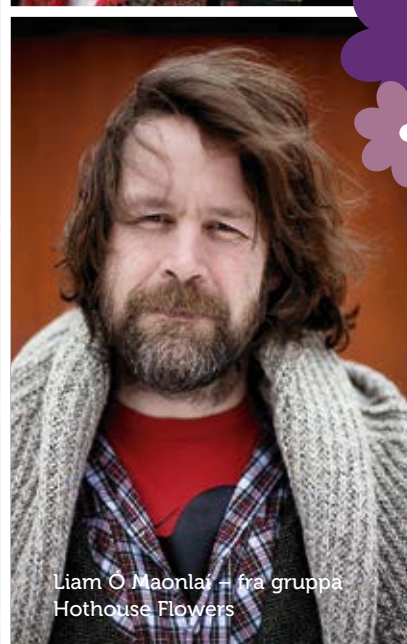
Liam O Maonlaí – fra gruppa Hothouse Flowers